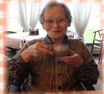
食後のコーヒー堪能中☆