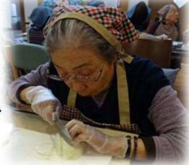
②野菜を切る。 玉ねぎで涙が出てても我慢！