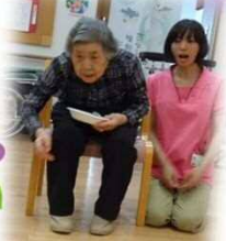
お手玉入れゲーム