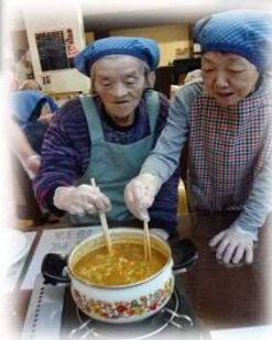
⑤ルーと隠し味を入れてさらに 煮込む ※今回の隠し味は愛です♡