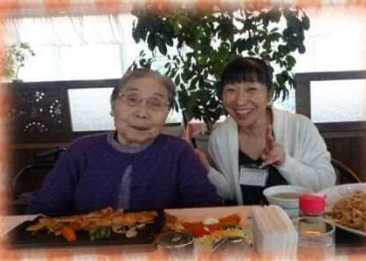
豪華な昼御飯だね～