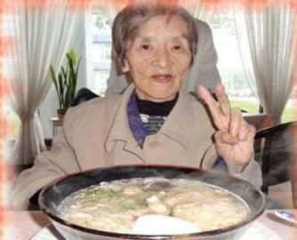
私の顔より大きい器！！