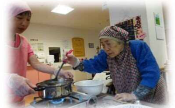
④アクを取って煮込んでいく