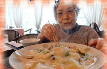
全部食べられるかしら～ (*ω*)