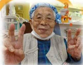
ねじりはちまき お似合いです♡