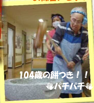
104歳の餅つき!! ↓パチパチ↓