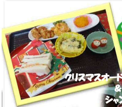
クリスマスオードブル & シャンメリータワー

20日にクリスマスオードブル&シャンメリータワーで 一足早いクリスマス会を行いました。 24日には、えべつキーハーブアンサンブル様に 来ていただきクリスマス会♪ 皆さんで、サンタの帽子を被り楽しみました☆