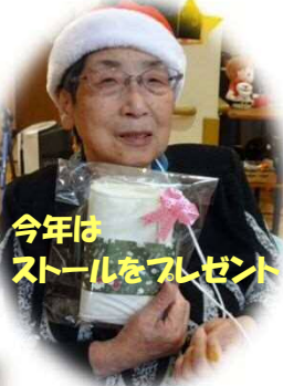
今年は ストールをプレゼント