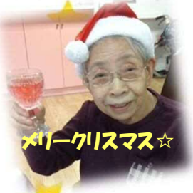
メリークリスマス☆