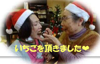
いちごを頂きました♡