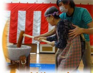
おいしょ~! おいしょ~!!