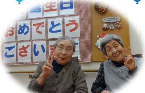
12月は2名の方がお誕生日を迎えま した。職員による、しい文字ゲームや抹茶 カステラでお祝いをしました!