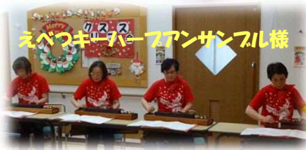
えべつキーハーブアンサンブル様