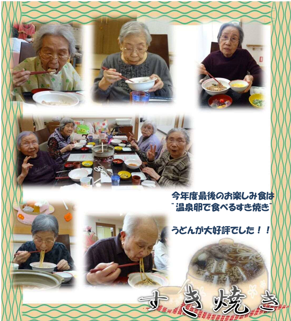
今年度最後のお楽しみ食は "温泉卵で食べるすき焼き"