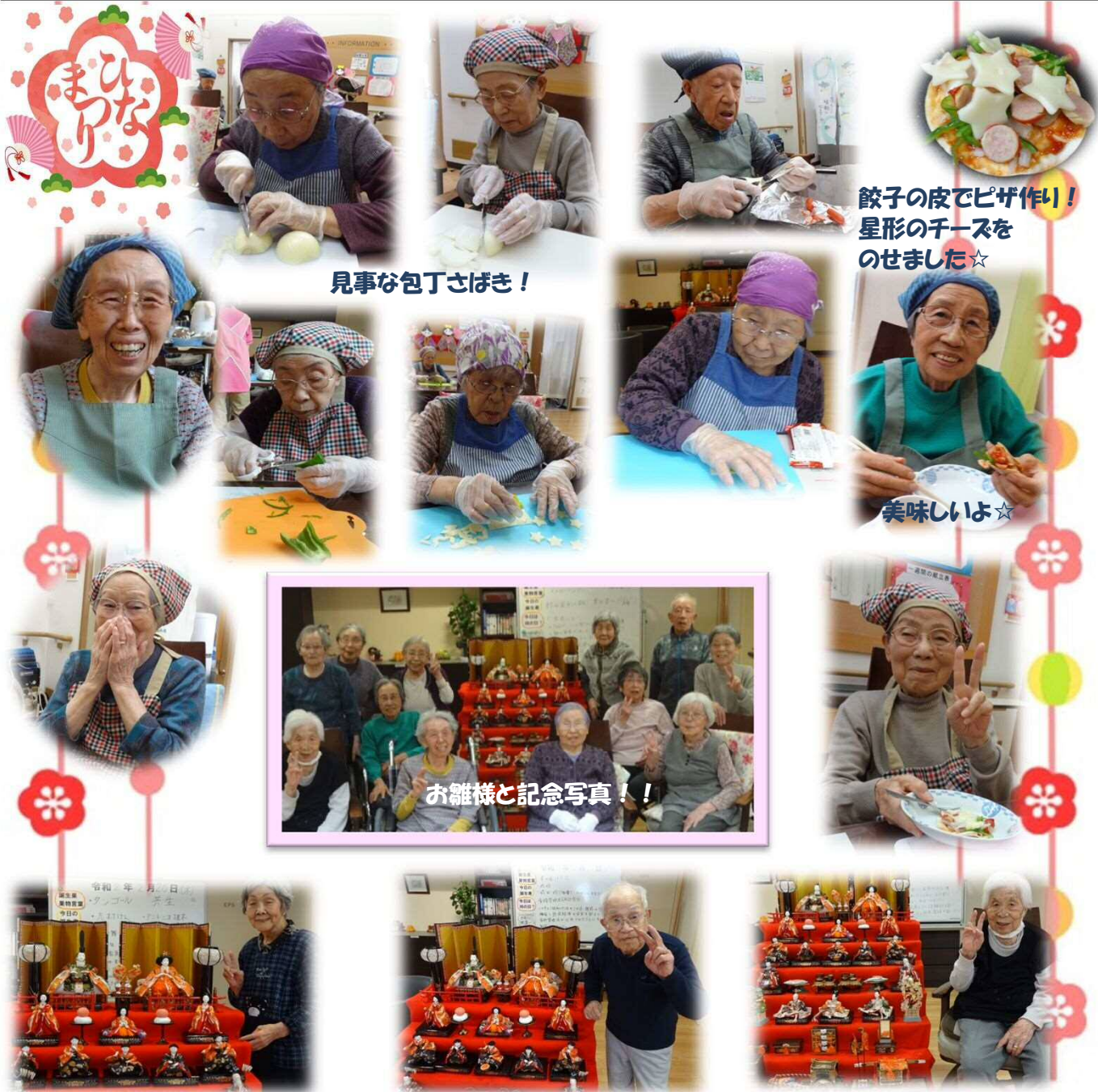
餃子の皮でピザ作り！ 星形のチーズを のせました☆