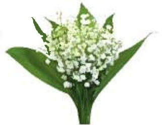
花音の花 すずらん