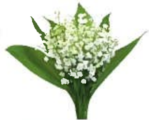
花音の花 すずらん