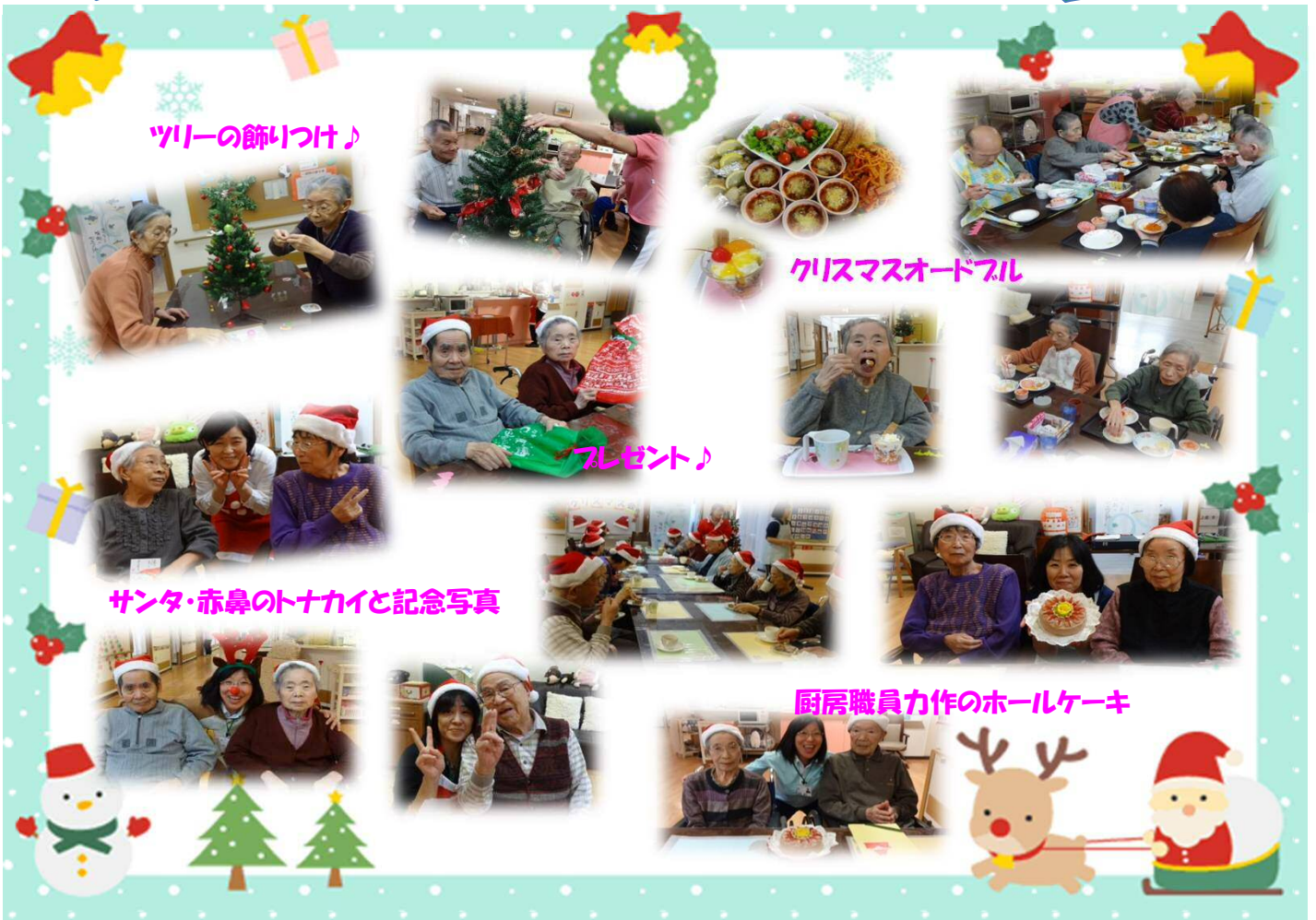
ツリーの飾りつけ♪