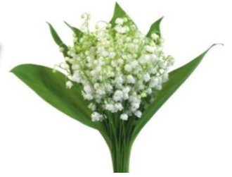
花音の花 すずらん