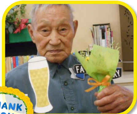
6月16日の父の日は、職員がお菓子にトッピングをしました♪