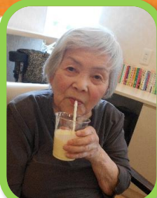
マンゴーラッシー ナゲット サラダ コンソメスープ もありました♪