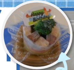
カノン君も6月13日に13歳を迎えました!! 1階入居者様にお祝いしてもらって 美味しいケーキも食べました♪