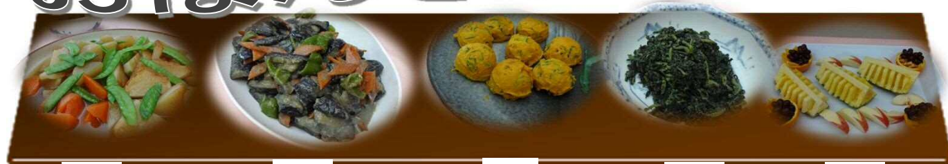
大根とさつま揚げの煮物