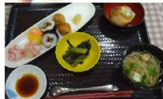
生ものの未使用メニュー