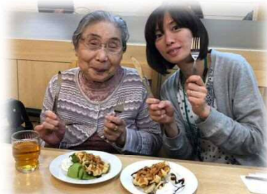
グラタンパン最高!!