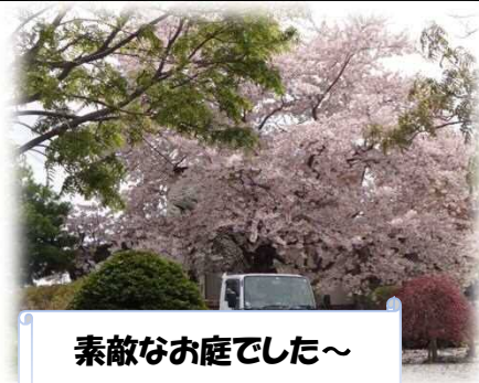
素敵なお庭でした～