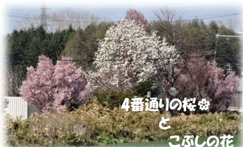
4番通いの桜❀ と こぶしの花